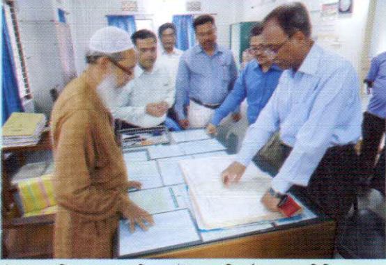
উপজেলা হিসাব রক্ষণ অফিস, লৌহজং পরিদর্শন করছেন সিজিএ