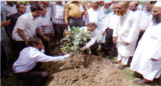
বৃক্ষ রোপন অনুষ্ঠানে সিজিএ গাছের চারা রোপন করছেন

নির্ধারিত ভ্রমণসূচী অনুযায়ী ২৫ এপ্রিল, ২০১৫ তারিখে হিসাব মহানিয়ন্ত্রক ডিভিশনাল কন্ট্রোলার অব একাউন্টস এর কার্যালয়, রাজশাহীতে আগমন করেন এবং সেখানে জেলা ও উপজেলা হিসাবরক্ষণ কর্মকর্তাদের নিয়ে আয়োজিত এক মত বিনিময় সভায় অংশগ্রহণ করেন। সরকারী কর্মকর্তা হিসেবে প্রযুক্তিকে যথাযথ ভাবে কাজে লাগিয়ে গুণগত সেবা প্রদানের বিষয়ে তিনি গুরুত্ব আরোপ করেন। এ প্রসঙ্গে তিনি সম্প্রতি চালুকৃত বিল কিয়ারিং স্ট্যাটাস ও সিজিএ ওয়েব সাইটের মাধ্যমে জমাকৃত চালান ভেরিফিকেশন এর বিষয়টি সবাইকে অবহিত করেন। ইতোপূর্বে তিনি ডিসিএ, রাজশাহী কার্যালয় প্রাঙ্গনে আয়োজিত পিঠা উৎসব ও বৃক্ষ রোপন অনুষ্ঠানে অংশগ্রহণ করেন এবং ডিসিএ কার্যালয়ের রেস্ট হাউজ ও সম্মেলন কক্ষের উদ্বোধন করেন।