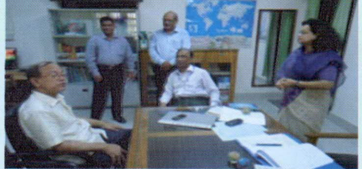
সিএন্ডএজি ও সিজিএ'র সাথে উপস্থিত অন্যান্য কর্মকর্তা