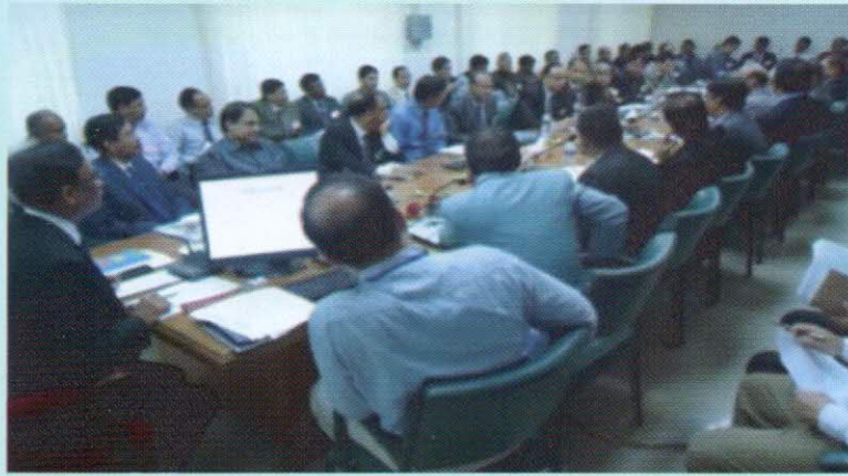
বিপিএটিসি'র সামরিক ও বেসামরিক কর্মকর্তাগণের উদ্দেশ্যে বক্তব্য রাখছেন সিজিএ

বিপিএটিসি, সাভারে বিভিন্ন কোর্সে অংশগ্রহণকারী, সামরিক ও বেসামরিক কর্মকর্তাগণের সিজিএ কার্যালয়ে প্রশিক্ষণ : বিপিএটিসি, সাভারের চলমান ৭০তম Senior Staff Course (SSC) এবং ৯৯তম Advanced Course on Administration And Development (ACAD)- এ অংশগ্রহণকারী কর্মকর্তাগণ বিগত ২৩ ফেব্রুয়ারী, ২০১৫ খ্রিঃ তারিখে সিজিএ কার্যালয়ে এক দিনের সংযুক্তিমূলক প্রশিক্ষণে অংশগ্রহণ করেন। উক্ত প্রশিক্ষণে সিজিএ মহোদয় সরকারী আর্থিক ব্যবস্থাপনায় সিজিএ কার্যালয়ের ভূমিকা সম্পর্কে বিস্তারিত তুলে ধরেন। পরবর্তীতে Online Bill Clearing Status, iBAS monitoring system এবং সরকারী হিসাব ব্যবস্থাপনার উপর সংক্ষিপ্ত উপস্থাপনার আয়োজন করা হয়।