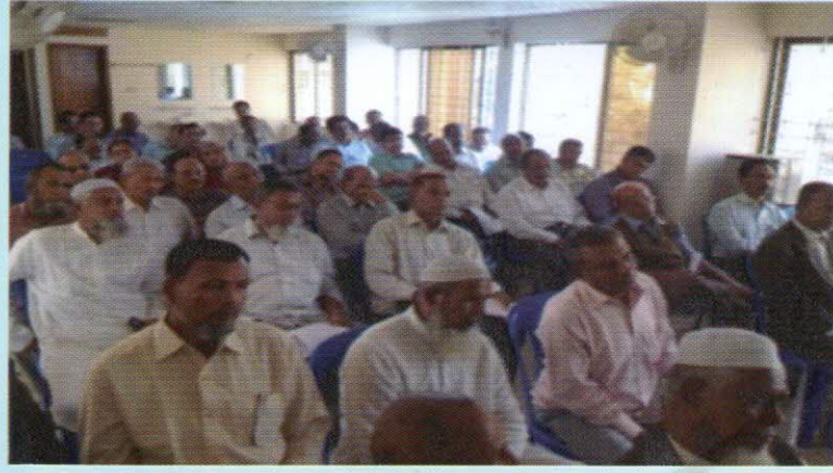
চট্টগ্রামের PRL বিষয়ক একটি প্রস্তুতিমূলক কর্মশালায় কর্মকর্তা কর্মচারীগণ

বিপিএটিসি, সাভারে বিভিন্ন কোর্সে অংশগ্রহণকারী, সামরিক ও বেসামরিক কর্মকর্তাগণের সিজিএ কার্যালয়ে প্রশিক্ষণ : বিপিএটিসি, সাভারের চলমান ৭০তম Senior Staff Course (SSC) এবং ৯৯তম Advanced Course on Administration And Development (ACAD)- এ অংশগ্রহণকারী কর্মকর্তাগণ বিগত ২৩ ফেব্রুয়ারী, ২০১৫ খ্রিঃ তারিখে সিজিএ কার্যালয়ে এক দিনের সংযুক্তিমূলক প্রশিক্ষণে অংশগ্রহণ করেন। উক্ত প্রশিক্ষণে সিজিএ মহোদয় সরকারী আর্থিক ব্যবস্থাপনায় সিজিএ কার্যালয়ের ভূমিকা সম্পর্কে বিস্তারিত তুলে ধরেন। পরবর্তীতে Online Bill Clearing Status, iBAS monitoring system এবং সরকারী হিসাব ব্যবস্থাপনার উপর সংক্ষিপ্ত উপস্থাপনার আয়োজন করা হয়।