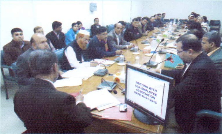
হিসাব মহানিয়ন্ত্রক এর সাথে সিজিএ কর্মচারী সমিতির নেতৃবৃন্দ