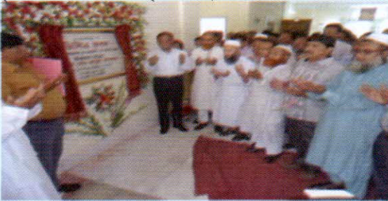
ডিসিএ, খুলনা কার্যালয়ের নবনির্মিত 'ডিসিএ ভবন' উদ্বোধনী অনুষ্ঠান

২৩ এপ্রিল তারিখে হিসাব মহানিয়ন্ত্রক খুলনা গমন করেন এবং সেখানে জেলা ও উপজেলা হিসাবরক্ষণ কর্মকর্তাদের এক সভায় মত বিনিময় করেন। সার্ভিস ডেলিভারীর ক্ষেত্রে সৃষ্ট জটিলতা নিরসনের জন্য তিনি কর্মকর্তাদের পারস্পারিক আলাপ আলোচনার উপর গুরুত্ব আরোপ করেন। মত বিনিময় সভায় অংশগ্রহণকারী কর্মকর্তাগণ তাদের বিভিন্ন দাবী-দাওয়াসহ অফিসে কর্মপরিবেশ উন্নয়ন ও আইটি সংশ্লিষ্ট পদ সৃষ্টি করার বিষয়ে সিজিএ মহোদয়ের দৃষ্টি আকর্ষণ করেন। তিনি বিভাগীয় হিসাব নিয়ন্ত্রক অফিসে এক বৃক্ষ রোপন অনুষ্ঠানে অংশগ্রহণ করেন এবং ডিসিএ, খুলনা কার্যালয় প্রাঙ্গনে নবনির্মিত 'ডিসিএ ভবন', একটি মসজিদ, সিটিজেন চার্টার ও 'ডিসিএ নিউজ' নামের একটি প্রকাশনার উদ্বোধন করেন। সন্ধ্যায় ডিসিএ, খুলনা কার্যালয় কর্তৃক পিঠা উৎসব ও সাংস্কৃতিক অনুষ্ঠানের আয়োজন করা হয়।