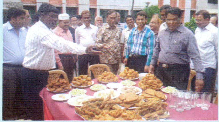
ডিসিএ, রাজশাহী কার্যালয়ে আয়োজিত পিঠা উৎসব অনুষ্ঠান

নির্ধারিত ভ্রমণসূচী অনুযায়ী ২৫ এপ্রিল, ২০১৫ তারিখে হিসাব মহানিয়ন্ত্রক ডিভিশনাল কন্ট্রোলার অব একাউন্টস এর কার্যালয়, রাজশাহীতে আগমন করেন এবং সেখানে জেলা ও উপজেলা হিসাবরক্ষণ কর্মকর্তাদের নিয়ে আয়োজিত এক মত বিনিময় সভায় অংশগ্রহণ করেন। সরকারী কর্মকর্তা হিসেবে প্রযুক্তিকে যথাযথ ভাবে কাজে লাগিয়ে গুণগত সেবা প্রদানের বিষয়ে তিনি গুরুত্ব আরোপ করেন। এ প্রসঙ্গে তিনি সম্প্রতি চালুকৃত বিল কিয়ারিং স্ট্যাটাস ও সিজিএ ওয়েব সাইটের মাধ্যমে জমাকৃত চালান ভেরিফিকেশন এর বিষয়টি সবাইকে অবহিত করেন। ইতোপূর্বে তিনি ডিসিএ, রাজশাহী কার্যালয় প্রাঙ্গনে আয়োজিত পিঠা উৎসব ও বৃক্ষ রোপন অনুষ্ঠানে অংশগ্রহণ করেন এবং ডিসিএ কার্যালয়ের রেস্ট হাউজ ও সম্মেলন কক্ষের উদ্বোধন করেন।