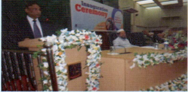
এমপিএ এর উদ্বোধনী অনুষ্ঠানে বিশেষ অতিথির বক্তব্য রাখছেন সিজিএ