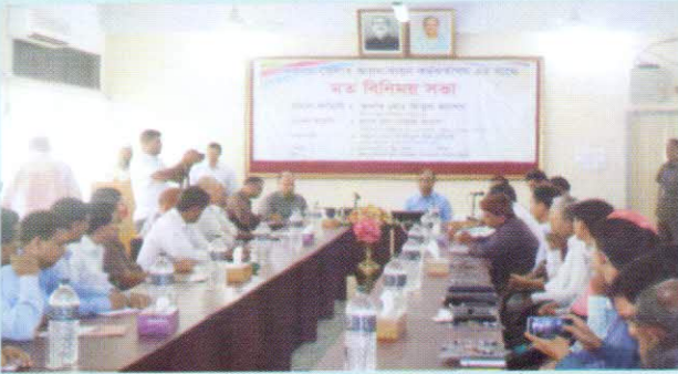
বান্দরবানে ডিডিওদের সাথে মত বিনিময় অনুষ্ঠান

ডিডিওদের সাথে মতবিনিময়ঃ যে কোন বিল নিষ্পত্তির ক্ষেত্রে হিসাবরক্ষণ অফিসের যেমন ভূমিকা আছে, সংশ্লিষ্ট আয়ন ব্যয়ন কর্মকর্তারও (ডিডিও) তেমন দায় দায়িত্ব রয়েছে। হিসাবরক্ষণ অফিসের পাশাপাশি ডিডিও গণের প্রি-অডিট সম্পর্কিত আইন কানুন ও বিধিবিধান সম্পর্কে সম্যক ধারণা থাকলে স্বল্পতম সময়ে গুণগত মানসম্পন্ন সেবা প্রদানের বিষয়টি নিশ্চিত করা যায়। এর ধারাবাহিকতায় গত ১৭ থেকে ১৯ মে, ২০১৫ তারিখে সিজিএ রাঙ্গামাটি ও বান্দরবান জেলা হিসাবরক্ষণ অফিস পরিদর্শনকালে জেলার বিভিন্ন অফিসের আয়ন ব্যয়ন কর্মকর্তাদের সাথে তিনি একাধিক মত বিনিময় অনুষ্ঠানে যোগদান করেন।