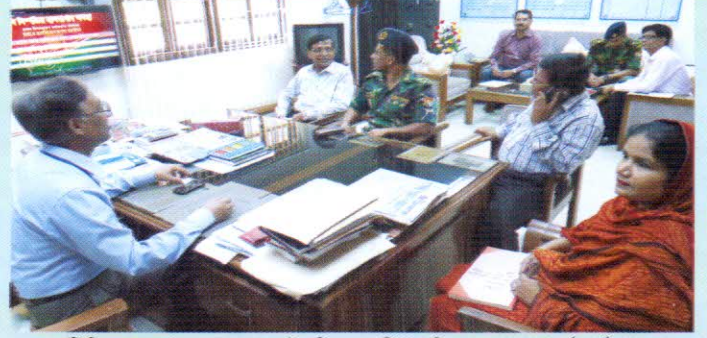
সিজিএ এর সাথে মহামান্য রাষ্ট্রপতির সামরিক সচিব ও অন্যান্য কর্মকর্তাগণ